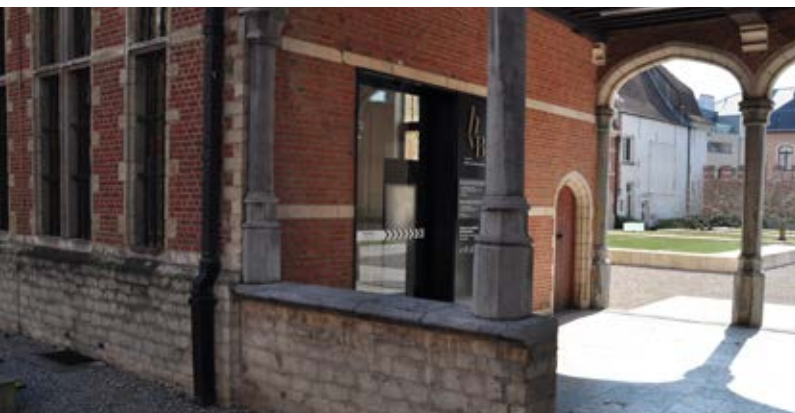
Ingang Frederik de Merodestraat

Ik wandel door de grote poort de tuin van het museum binnen. Op de foto staat de poort halfopen. Het kan ook zijn dat de poort volledig open staat.